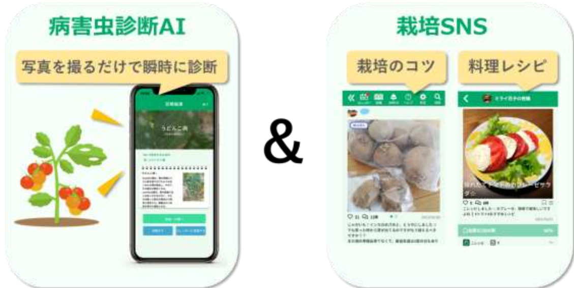
病害虫診断 AI&栽培 SNS SCIBAI の概要